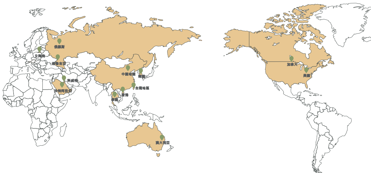
中國內地城市層級店舖分佈

以下地圖及圖表分別列示於二零一七年十二月三十一日我們在全球國家及地區的獨立實體零售店網絡分佈（不包含銷售點），中國內地、香港及台灣地區的零售店（包括獨立實體經銷商店及自營店）的地理分佈以及中國內地城市層級店舖分佈：