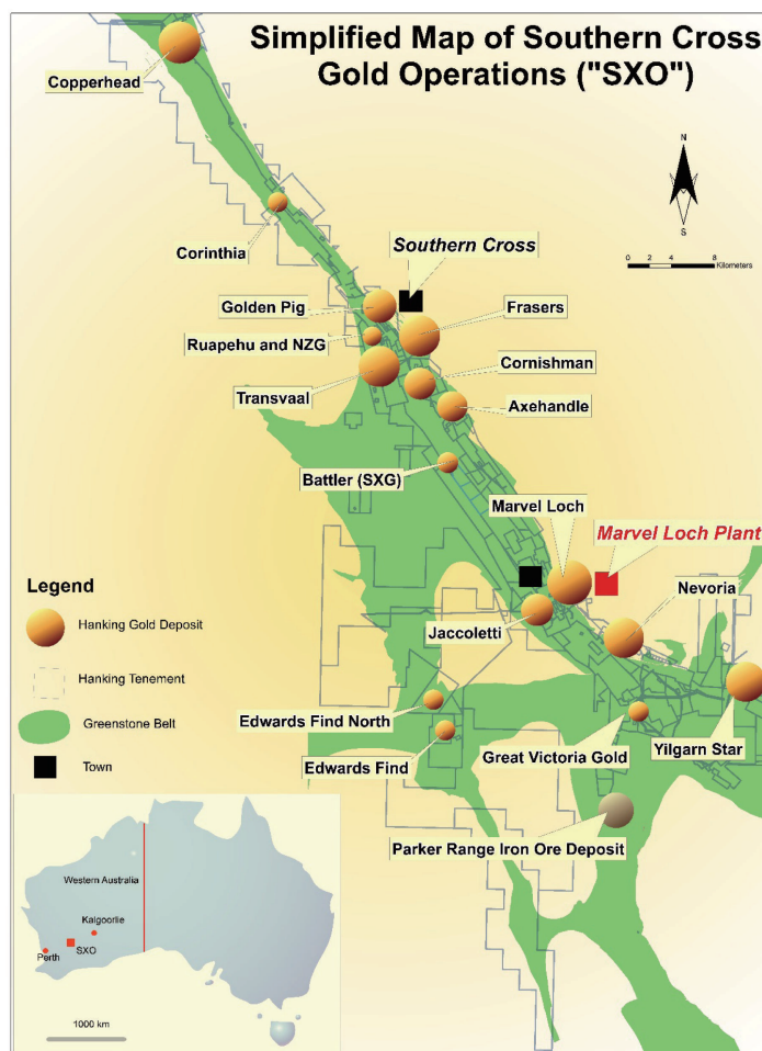
圖1－罕王黃金的SXO金礦項目礦權及主要金礦分佈圖

PNP公司是一家澳大利亞專業採礦設備與地下採礦服務公司。其客戶包括必和必拓、力拓、嘉能可等全球性礦業公司和眾多中小型礦業公司。擁有豐富的低成本地下開採經驗。其關鍵生產管理技術人員曾在Nevoria金礦項目工作，熟悉當地情況。