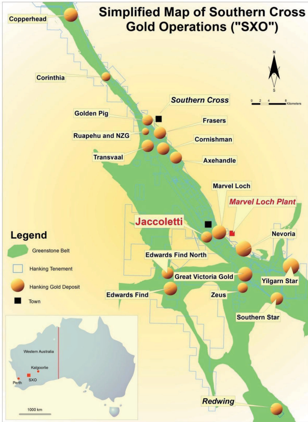
圖1－罕王黃金的SXO金礦項目金礦分佈圖