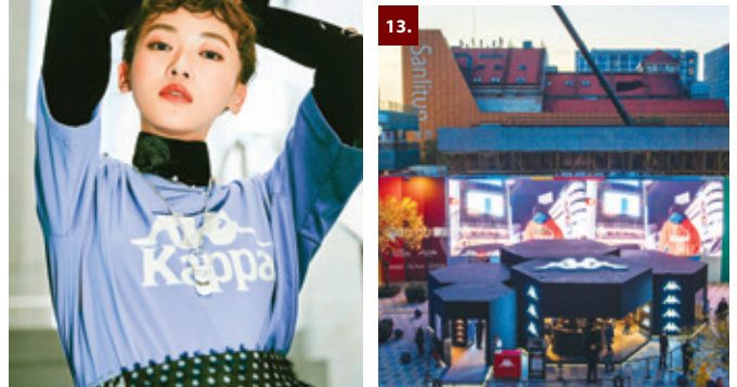
1, 2. Kappa品牌參加天貓潮流盛典