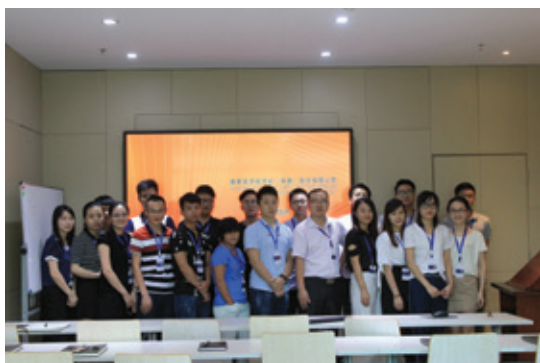
圖2：2017年新入職員工培訓

集團人本部負責統籌培訓管理工作，嚴格考核員工出席率，並對培訓過程進行監督，以保證培訓效果。人本部綜合培訓出席率、課件精良程度、員工培訓效果對培訓課程進行評分；向優秀課程的組織部門發放培訓激勵補貼，以調動組織部門的積極性，促進培訓課程質量的持續提升。