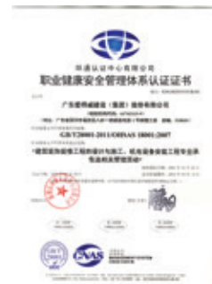
圖7：愛得威職業健康安全管理体系認證證書

2017年8月，集團聘請外部心理專家為全體員工進行心理健康主題培訓，詳細解析職場常見心理問題與應對方法，幫助員工舒緩職場壓力，預防心理疾病，實現健康生活、快樂工作。