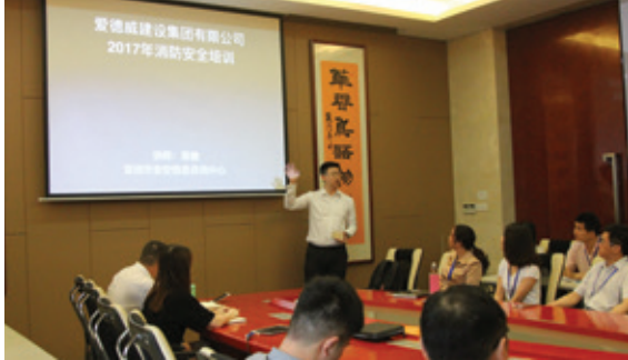
圖5：2017年消防安全培訓