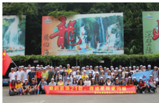
圖4：2017年度清遠戶外拓展活動

在薪酬回報的基礎上，集團建立了完善的福利制度，以展現員工關懷。集團依法為員工繳納五險一金，保障員工享有國家法定節假日、公休日、婚假、生育假等。同時，員工亦享有年假、年度健康體檢、節日禮品、生病慰問等多項福利。2017年度，集團每周組織羽毛球活動，並多次組織員工郊遊和戶外拓展活動，鼓勵員工平衡工作與生活，促進團隊溝通理解，提高團結協作精神。