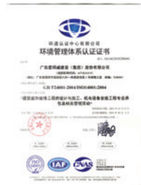
圖1：愛得威環境管理體系認證證書

對一般辦公垃圾實行分類收集、日產日清，對於可回收的報紙、鋁罐交由回收站集中處理，其餘一般垃圾由環衛站集中清運。